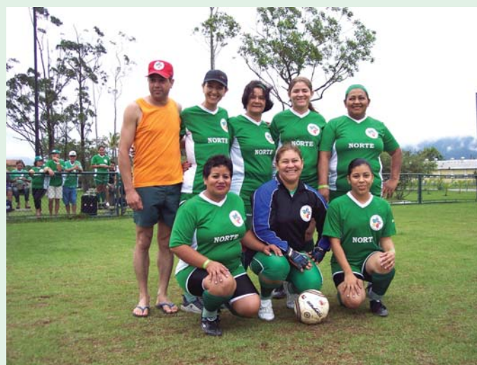
Seleção feminina de futebol de campo da Região Norte afinada para a partida.