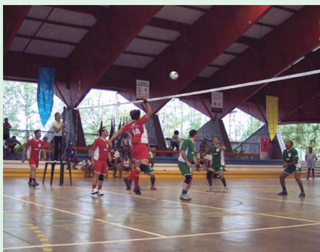
Norte e Sul do País se encontram em quadra e transformaram uma simples partida de vôlei em rali eletrizante.