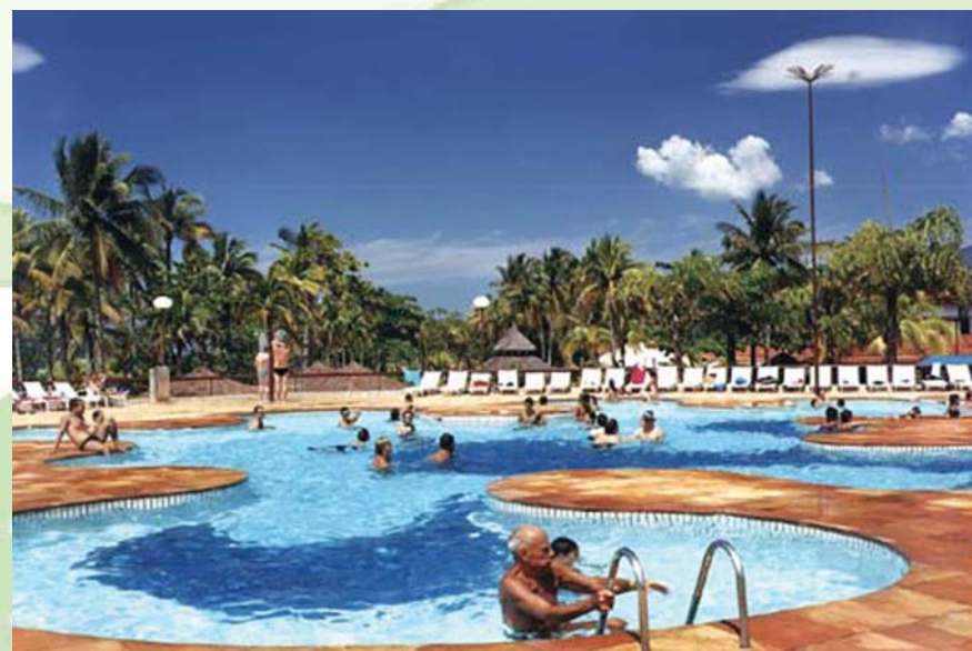
Parque aquático do Sesc-Bertiooga, SP.

Veja nesta edição os melhores momentos do III Encontro Embrapa Brasil, registrados pelas câmeras de vários colegas, além da relação dos melhores colocados, por modalidade.