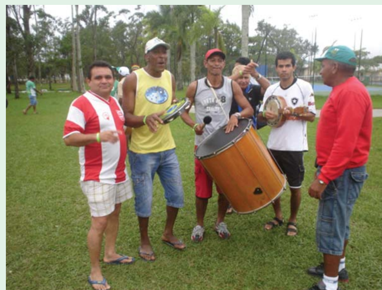
Não faltou o famoso pagode de improviso feito por associados de diferentes AEEs.