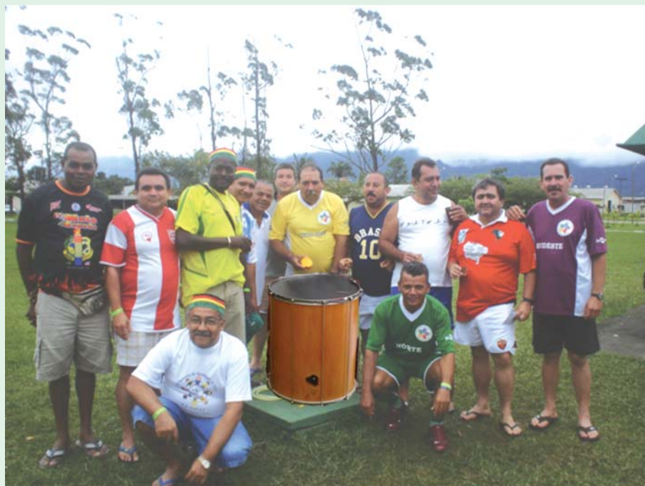
A confraternização entre os presentes foi uma constante.

Bailes com grupos musicais variados, diversidade de ritmos que iam de samba a Beatles, teatros de fantoches para crianças, ginástica recreativa e até apresentação de grupo folclórico. Tudo isso e muito mais fizeram parte dessa festa que entrou para a história dos encontros promovidos pela Federação.