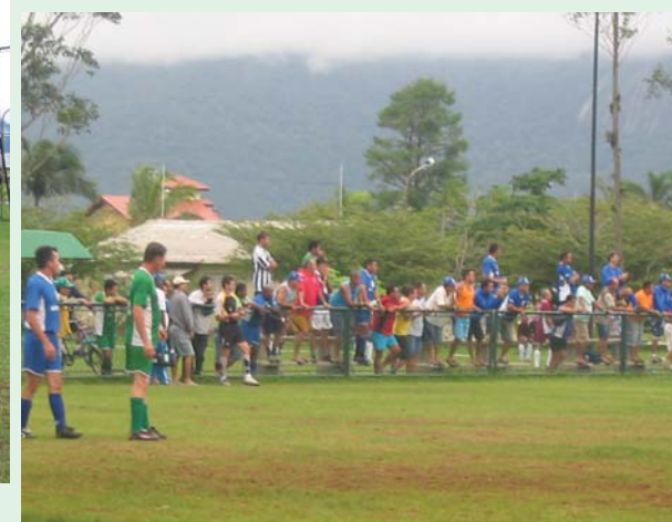
O público também deu seu show e prestigiou a atuação dos colegas.