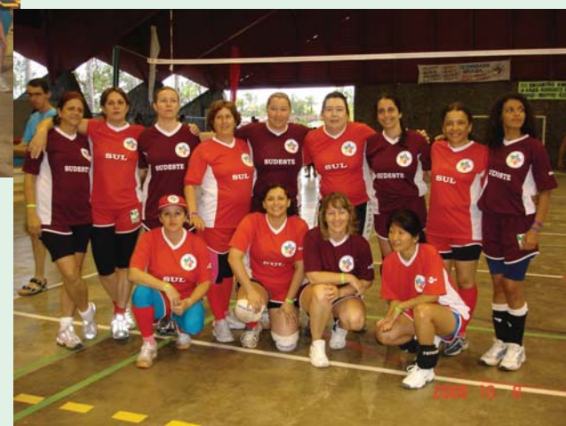
As atletas do Sudeste e Sul em clima de descontração antes do jogo.