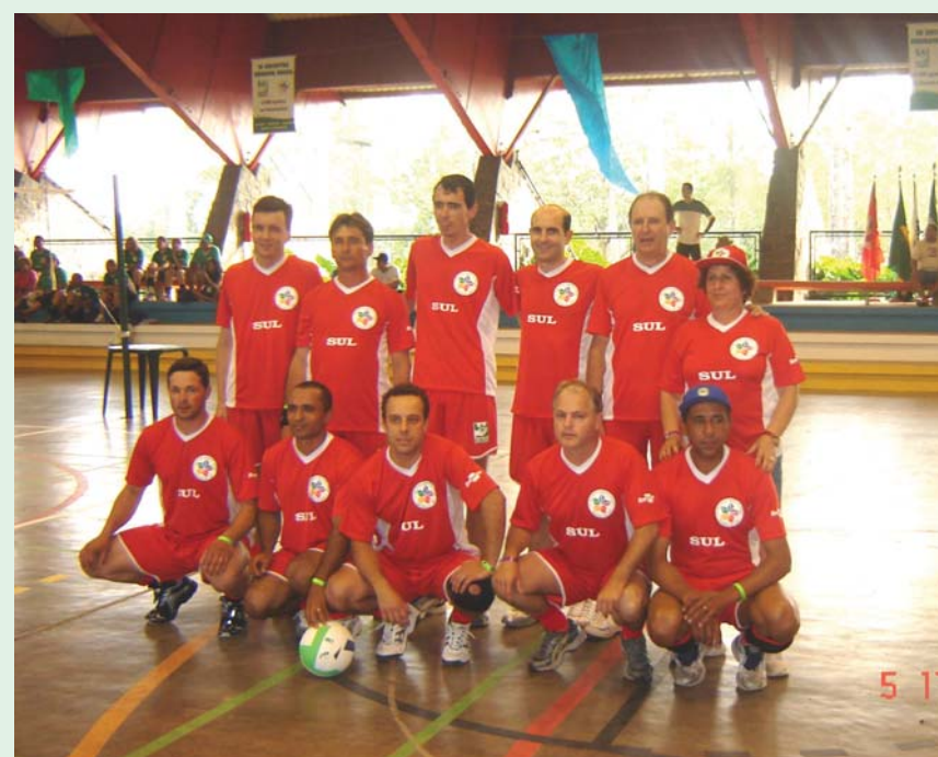
O vôlei do Sul, mais uma vez, mostrou porque é uma das equipes mais fortes e entrosadas da modalidade.