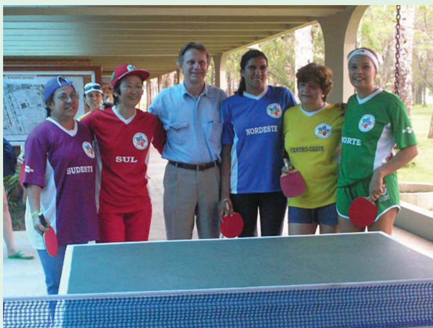
Silvio Crestana, diretor-presidente da Embrapa, com atletas do Tênis de Mesa Feminino.

Os jogos foram bem disputados, mas sempre em clima de amizade. Nenhum incidente grave foi registrado durante os dias de competição, reinando apenas a harmonia. A despeito da falta de experiência de alguns “atletas”, todos demonstraram que a competição só é válida quando se coloca o coração e a amizade em primeiro lugar. Apesar de o encontro ter sido protagonizado por atletas amadores, o exemplo de respeito e esportividade fez dessas olimpíadas um verdadeiro show de descontração e alegria.