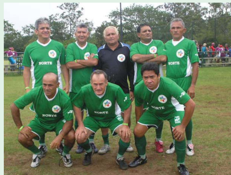
Equipe da Região Norte, campeã do Futebol Sete Masculino.