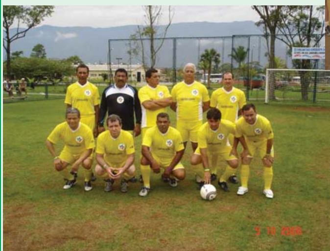
Pausa dos rapazes do Centro-Oeste para foto antes da tradicional competição de Futebol Sete Masculino.