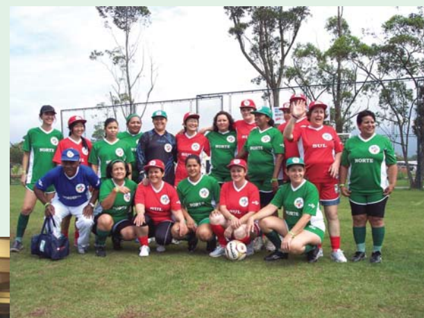
Norte e Sul mais uma vez se uniram para fazer uma festa de fraternidade em campo.