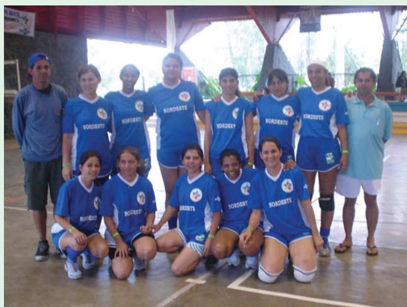
Equipe de vôlei feminino da Região Nordeste.