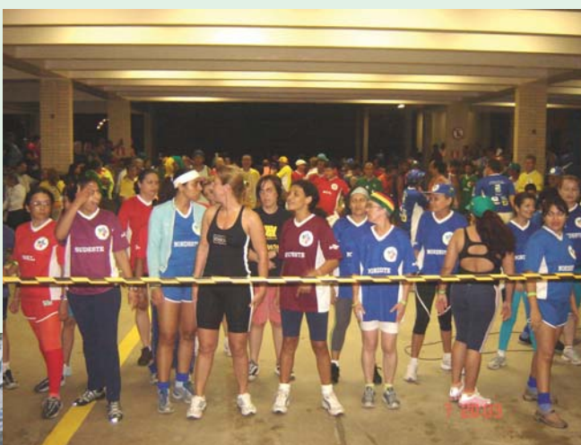
Nem mesmo o cair da noite parava os jogos. Às 19h do 4º dia de competição, as mulheres deixaram os homens para trás e foram em busca do ouro no atletismo.