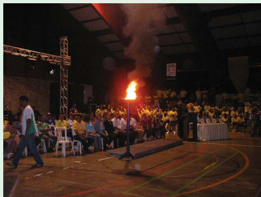
Fogo simbólico dos jogos.