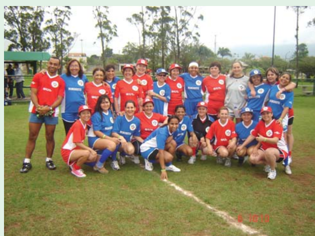
Prova de união e amizade entre as meninas do Sul e Nordeste, antes da partida de futebol.