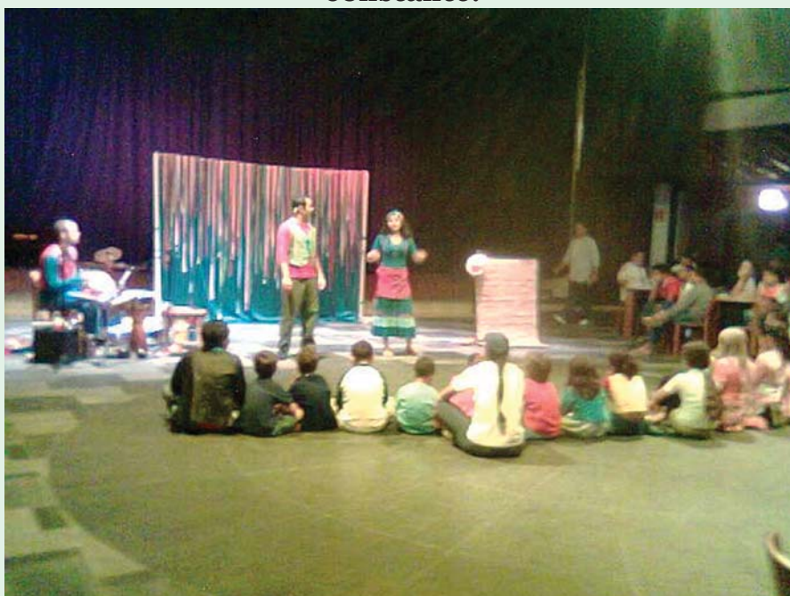
O grupo Cantando o Brasil/Cia. Palavras Andantes encantou crianças e adultos com histórias do folclore nacional.